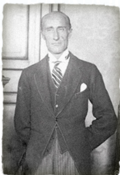
Il Governatore di Roma nel 1927 Ludovico Spada Potenziani

Nella lettera si fa riferimento alle attività sportive del Foot Ball Club di Roma, militante nella Divisione Nazionale (a differenza di Fortitudo ed Alba, appena retrocesse), presso la Rondinella.